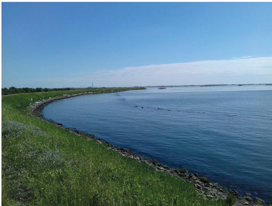
Tratto – st. 63-66 Molo frangiflutti sommerso oggetto di intervento – vista a valle